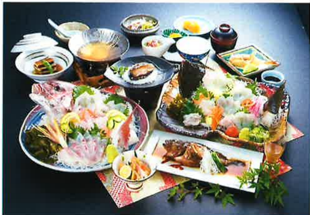
『活魚の美舟』料理イメージ (4名様盛り)