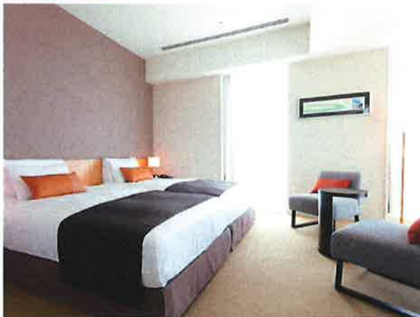
デラックスツイン(約 35m 2 )