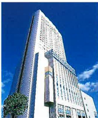
ANA クラウンプラザホテルグランコート名古屋