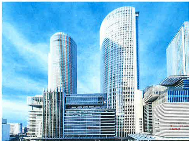
名古屋駅直結『名古屋マリットアソシアホテル』