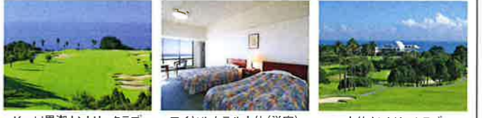
Kochi黒潮カントリークラブ ロイヤルホテル土佐(洋室) 土佐カントリークラブ