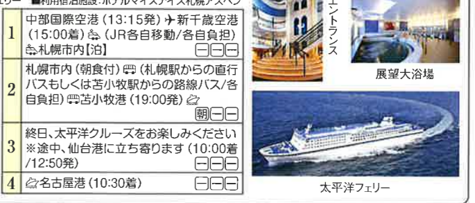
展望大浴場 太平洋フェリー

※1等インサイド1名利用の場合4,000円増 ※特等を1名利用の場合8,000円増 ※2等、B寝台、S寝台は相部屋となります ※1名参加の場合は3,000円増