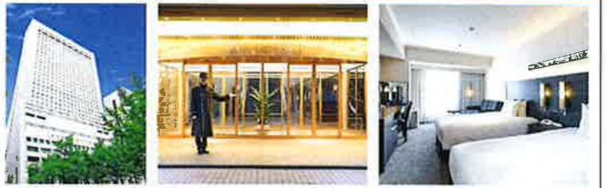
外観 エントランス スタンダードツイン