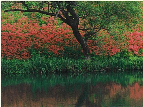
津屋川の彼岸花(丹羽省吾先生撮影2021年)

★津屋川の堤防沿いを彩る彼岸花。雄大な養老山脈を望み、堤防の斜面を見渡す限り赤に染めた景色は圧巻です。約10万本の彼岸花が3kmに渡って群生する絶景を散策しながら撮影します。