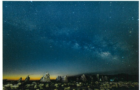
「暁の天の川」藤森 源久様(中日ツアーズフォトコン2023年入賞作品)

★橋杭岩の眼前にあるホテルに宿泊。橋杭岩と星空を存分に撮影、早朝の荒船海岸では海霧を狙います。