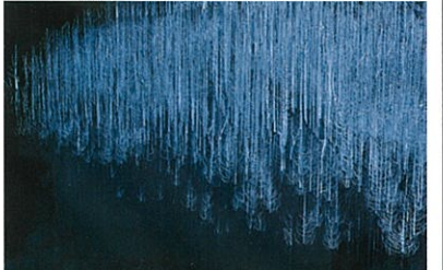
湯西川(月光の水没林)

※このコースでは積雪状況によっては、雪道の移動があるため、軽アイゼンをお持ちください(有料レンタル有)。