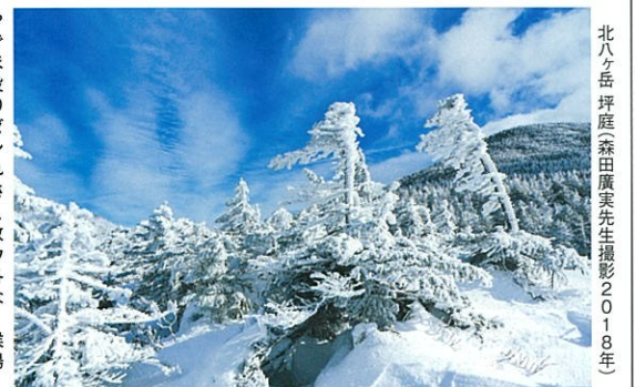
北八ヶ岳 坪庭(森田廣実先生撮影2018年)

※冬の坪庭は、木道や階段などが全て雪で埋まっていることがほとんどです(特に階段部分は急傾斜となります)ので、軽アイゼン(必携)、トレッキング用のストック(あれば)をお持ちください。ご希望の方には、軽アイゼンを貸出致します(有料)ロープウェイ山頂駅周辺を各自のペースで歩きながら撮影します。 ※雪、樹氷などは、天候により見られない場合があります。