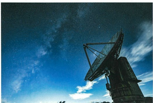
パラボラと天の川(野辺山観測所星空撮影イベントにて2024年)