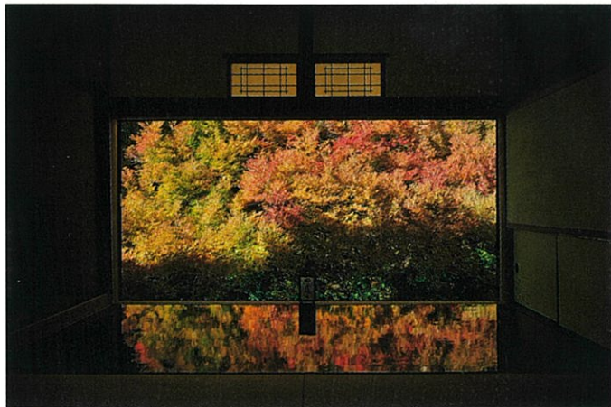
安国寺の紅葉(竹下光士先生撮影2024年)

※紅葉状況、社寺の一般公開の予定変更などにより、立ち寄り先が変更となる場合もあります。