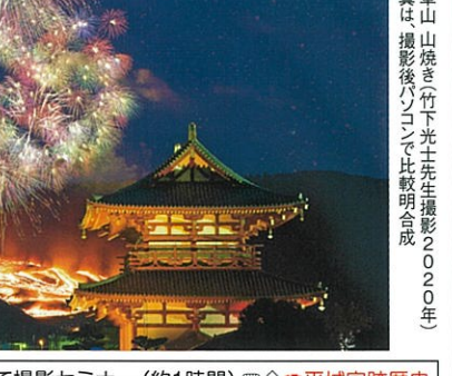
若草山山焼き2020年 写真は撮影後パソコンで比較明合成

※山焼きは雨天や強風の場合は順延となります。その場合でもツアーは中止せず、東大寺の夕景など代案地での撮影となります。