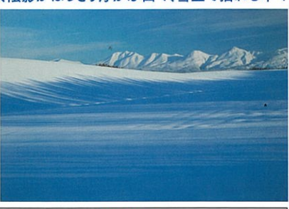
雪原に広がる青い影 美瑛ブルー

※早朝から日中の撮影をメインとするため、夕景の撮影予定はありません。 ※羽田空港で約2時間乗り継ぎ時間があります。