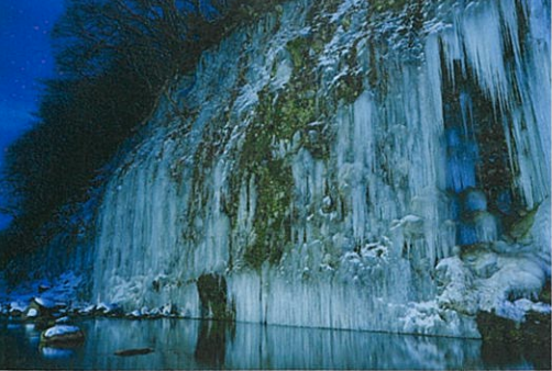
白川氷柱(井上嘉代子先生撮影2023年)

※凍結した雪道の移動があるため軽アイゼンをお持ちください(有料レンタル有)。白川氷柱群へは坂道を約5分歩きます。