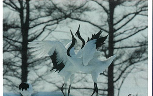
鶴居のタンチョウ (山本勝栄先生撮影2018年)

※2月の道東は、厳冬期です。天候によりですが、特に早朝は-10℃を下回る日もあります。 ※撮影地により積雪や凍結している場所があります。軽アイゼンをお持ちになると安心です。 ※流水、野生動物は諸条件によって見ることができない場合があります。 ※新千歳空港で約1~3時間乗継時間があります。