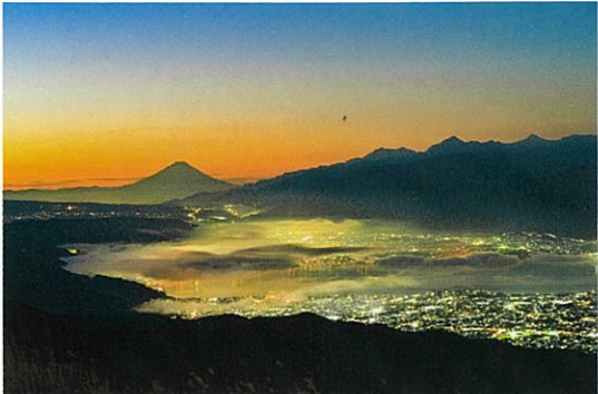
早朝の高ボッチ高原

★標高1665mの高ボッチ高原から北アルプスの山々はもちろん、諏訪湖、南アルプス、富士山まで見渡せます。