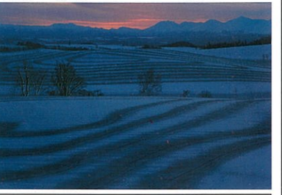
上富良野 朝焼けと融雪剤模様

※早朝から日中の撮影をメインとするため、夕景の撮影予定はありません。 ※羽田空港で約2時間乗り継ぎ時間があります。