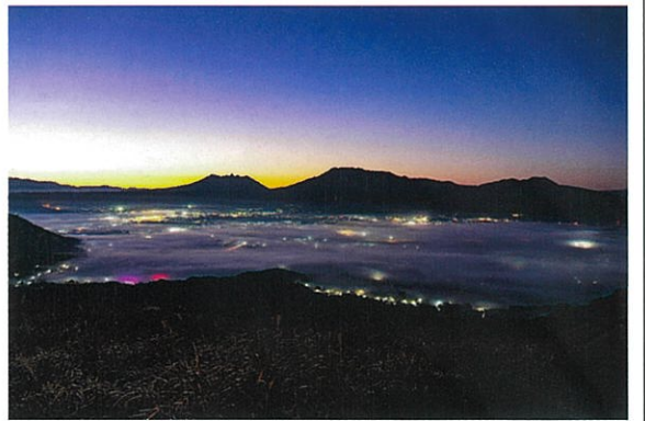
大観峰 雲海(森田廣美先生撮影2023年)

※菊池渓谷では、ゆるやかな坂のある地道の遊歩道(往復約2km)を各自のペースで歩きながら撮影します(約4時間滞在予定)