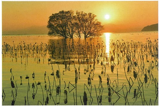
琵琶湖夕景(竹下光士先生撮影2017年)

★近江湖東の古刹・湖東三山に数えられる百済寺、金剛輪寺。重厚な石垣に覆われた『山城』の趣が漂う百済寺、深紅に染まる「血染めの紅葉」でも知られる金剛輪寺での秋景色の撮影をお楽しみください。