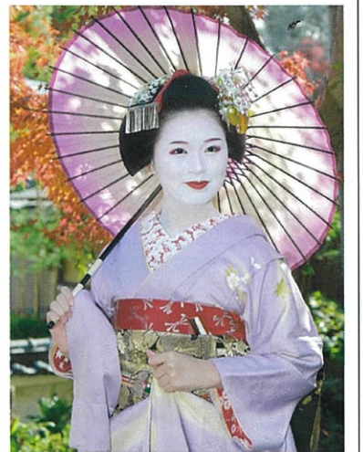
舞妓イメージ(丹羽省吾先生撮影2023年)

★講師は舞妓撮影のエキスパート! 24名様までの少人数設定で、祇園の舞妓はんをじっくりと撮影! ★室内と庭園でたっぷり3時間撮影予定です。