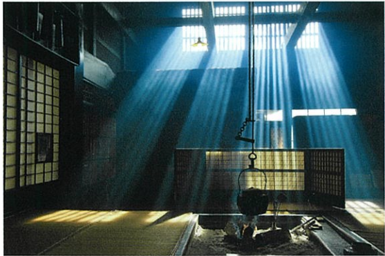
妻籠宿 囲炉裏に差し込む光芒 (竹下光士先生撮影2015年)