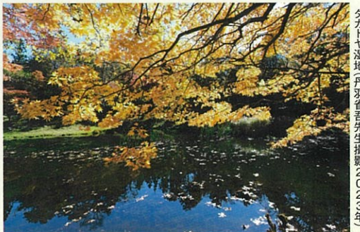
タカドヤ湿地

★旧稲武町の色鮮やかな紅葉ポイントを巡ります。水面に映り込む紅葉など、風情溢れる景色をゆっくりと撮影しましょう。