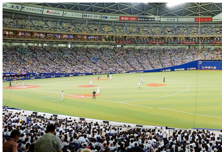
写真上：バンテリンドームナゴヤ 写真下：内野B席（2024年撮影）