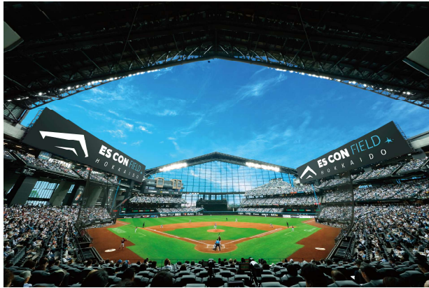
三層に分かれたスタンド構造