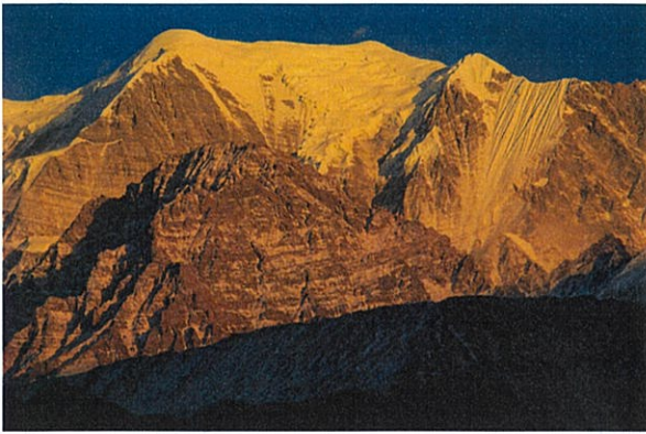
ジョンソン街道の村からみたニルギリ峰夕景