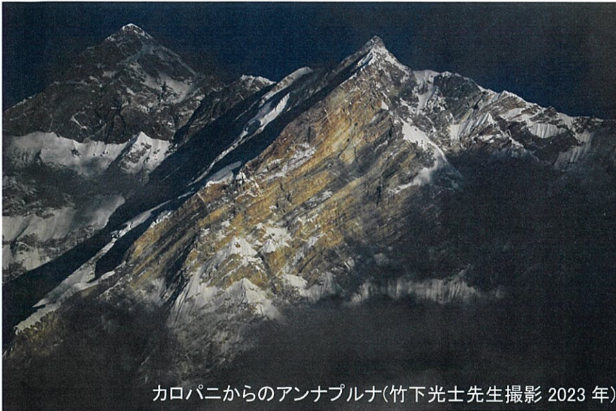
カロパニからのアンナプルナ