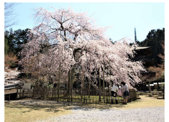
徳源院のしだれ桜

中世に北近江を支配した京極氏の菩提寺のお庭です。元々は池泉回遊式庭園でしたが、自然の力によって苔庭に移り変わりました。客殿の縁側から眺める庭はゆっくりと時が流れる癒しの空間です。例年4月上旬には樹齢300年を超えるしだれ桜が見ごろを迎えます。