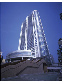
上：東京ドーム外観 下左：ホテル外観 下右：客室イメージ