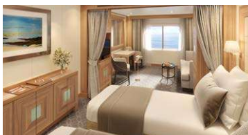
オーシャンビュースイート 25.3㎡~29.4㎡/4階 ※ベランダなし

【MITSUI OCEAN SAKURA シップデータ】 総トン数 32,477トン / 全長 198.15メートル / 全幅 25.6メートル / 客室数 229室 / 船客定員 458名