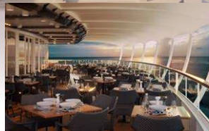
テラスレストラン八重