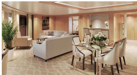
シグネチャースイート パトラーサービス付 87㎡/7階 (ベランダ55.7㎡)