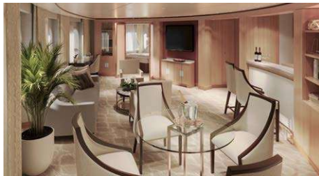
ラグジュアリースイート [A・B] パトラーサービス付 55.7㎡~87㎡/6~8階 (ベランダ8.8~36.1㎡)