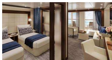
ペントハウススイート パトラーサービス付 48.8㎡~49.4㎡/10階 (ベランダ15.6~18.2㎡) ※スパ隣接