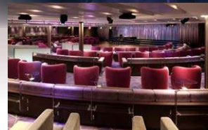
オーシャンステージ