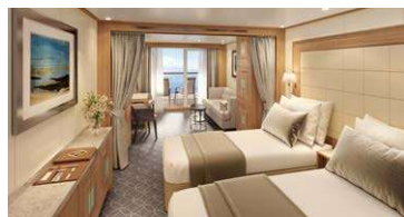
ベランダスイート [A~F] 24.4㎡~30.2㎡/5~10階 (ベランダ3.1~6.2㎡)