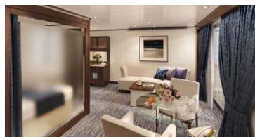
ペントハウススイート パトラーサービス付 39.7㎡~54.8㎡/6・9・10階 (ベランダ8~14㎡) ※6階1室