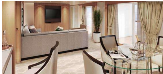
MITSUI OCEANスイート パトラーサービス付 82.4㎡/7階 (ベランダ16.8㎡)

全室海を望むスイートルーム。開放感とくつろぎが広がる洋上の我が家5つのカテゴリで、パトラーサービスをご利用いただけます。