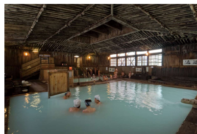
(左上) 五所川原『立佞武多』・(右上) 青森ねぶた祭『跳人』・(下左) 酸ヶ湯温泉・(下右) 酸ヶ湯温泉『千人風呂』 ※祭りは雨天決行ですが、荒天時は中止となる場合がございます。旅行代金の一部返金などはございません