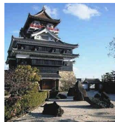
清洲城庭園(清須市)

日本初の女優「川上貞奴」が晩年に木曾川を一望できる景勝地に建てた別荘。貞奴の美意識を反映した内部意匠など、文化的な価値の高い建築が昭和初期の建設当時のまま残る。庭園は木曾川を望む開放的な芝庭や、茶室の周辺に露地がある。