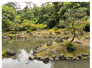
兵主大社庭園(野洲市)

兵主(ひょうず)大社庭園(国指定名勝) 池の護岸には豪華な石組みが残り、なだらかな築山には小ぶりながら形のいい庭石が配され、古庭園の風情が漂います。豪族になった神官の庭として鎌倉時代に造られたと考えられてきましたが、発掘調査の結果、作庭時期は平安時代にさかのぼることが分かりました。