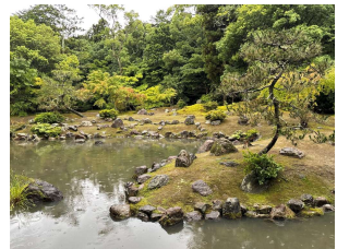
兵主大社庭園(野洲市)

池の護岸には豪華な石組みが残り、なだらかな築山には小ぶりながら形のいい庭石が配され、古庭園の風情が漂います。豪族になった神宮の庭として鎌倉時代に造られたと考えられてきましたが、発掘調査の結果、作庭時期は平安時代にさかのぼることが分かりました。